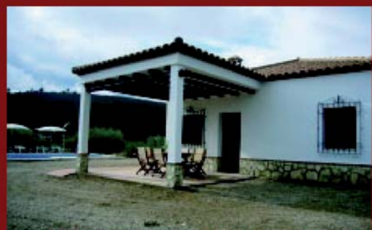
CASA RURAL LA SIERREZUELA