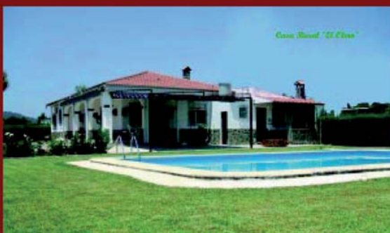
CASA RURAL EL OLMO